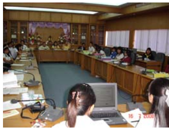
นิสิตนำเสนอผลงานวิจัย