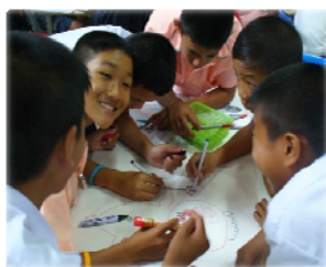
การเรียนรู้แบบร่วมมือ