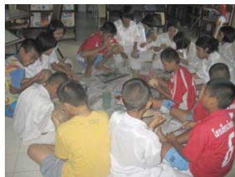
ตกแต่งกะลาหรรษา