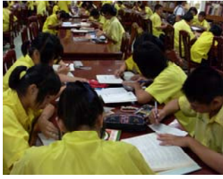
การระดมสมอง