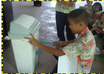
ถังหมักปุ๋ยรีไซเคิล