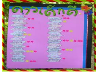
เสริมแรงดาวเด็กดี