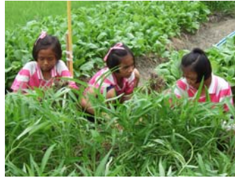
เกษตรสร้างสรรค์