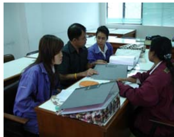
ปรึกษาอาจารย์พี่เลี้ยง