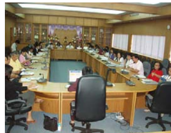
การสัมมนา