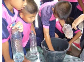
โครงการเลี้ยงกบในขวด