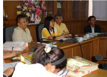
อาจารย์ติดตามความก้าวหน้า