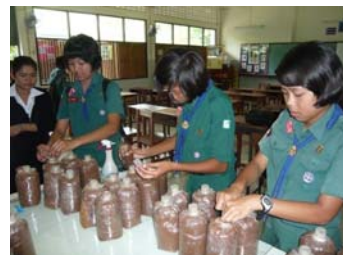
การฝึกข้ามสถานการณ์ทดลอง