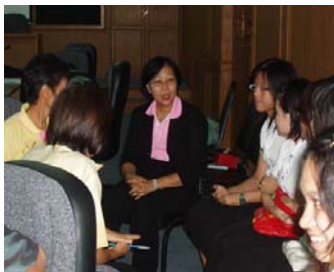
ปรึกษาอาจารย์นิเทศก์