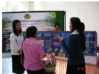
นำเสนอภาคโปสเตอร์