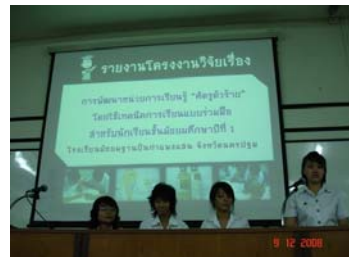
นำเสนอภาคบรรยาย

ภาพที่ 2 ภาพกิจกรรมแสดงกระบวนการพัฒนานวัตกรรมการเรียนรู้ของครูฝึกสอน